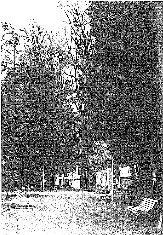
EL PARQUE BALLINA

por qué, la lluvia me trae en estas fechas ese olor de lagar que impregnaba la Villa en otoño. Y, encadenados, los recuerdos de las castañas con leche (¿existirá todavía la costumbre de «la pía»? «anda a la pía», se decía de las personas –mujeres sobre todo que, después de recoger los dueños la cose-