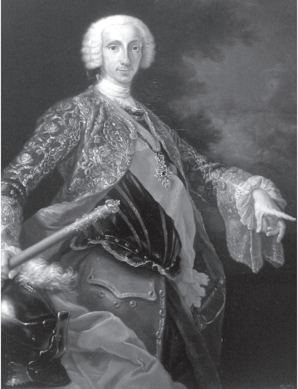
Carlos de Borbón, rey de las dos Sicilias , óleo sobre lienzo de Giuseppe Bonito (1707-1789), (reproducido con autorización de la Real Academia de Jurisprudencia y Legislación, Madrid)