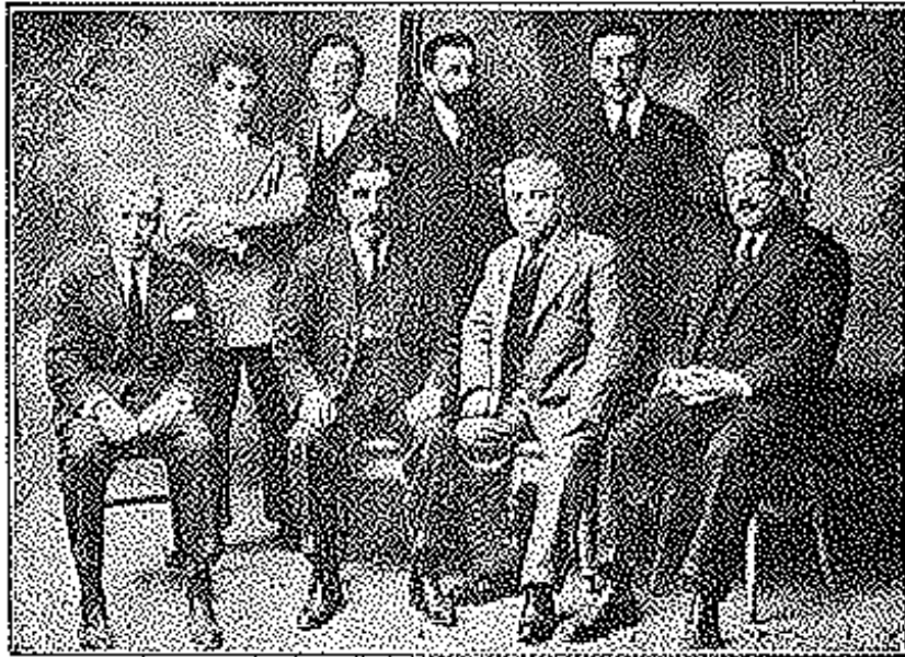
Villaviciosa.—Cuadro de Profesores del Ateneo Obrero.

Con un tercio de coste, sin que ello presente preocupaciones atmosféricas, ni