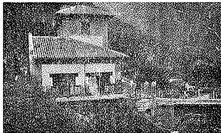
Otra vista parcial de la «Electro Canguesa»

Cuenta Villaviciosa con el antiguo y renombrado mercado general de los miércoles, al que concurren transadores de todas la provincia y