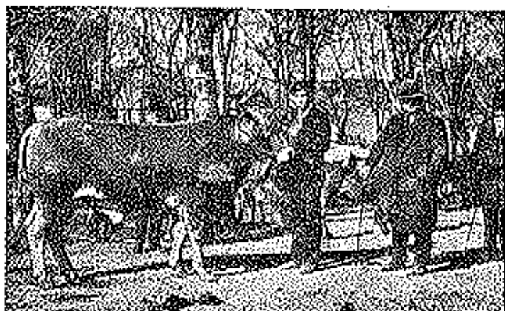
Villaviciosa.—Vista del mercado de ganados.

Los turistas deseosos de conocer y admirar las riquezas artísticas y la envi-