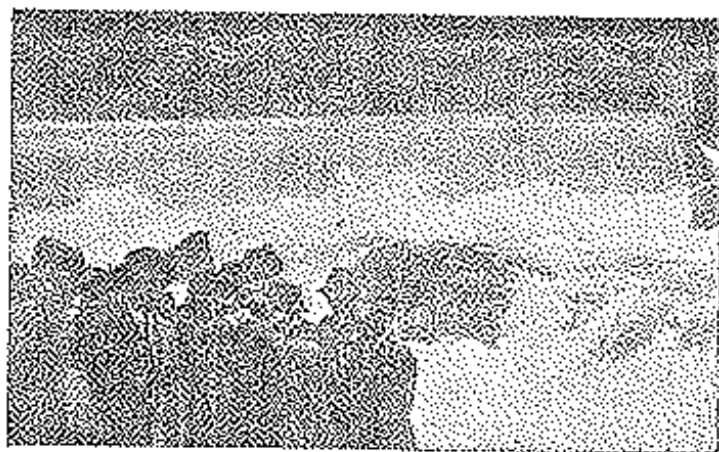
Vista de un salto de agua de la fábrica «Electro-Canguesa».