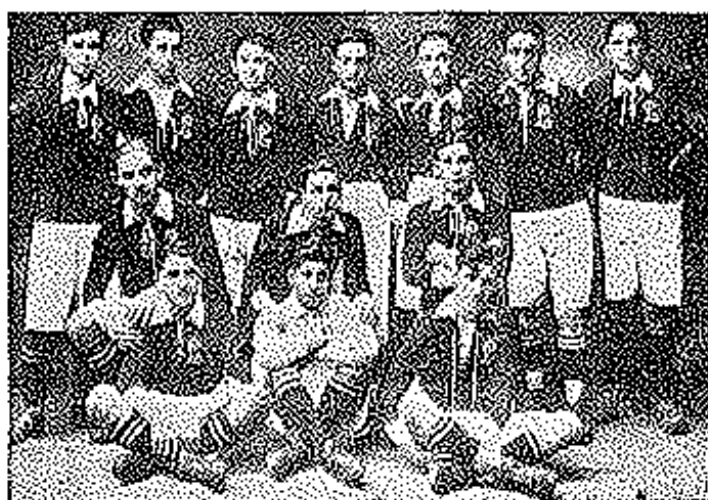
Villaviciosa.—Equipo de futbol «Lealtad» del año 1920.

pañerías y visuterías valiosas, y las gentes menesterosas adquiriendo géneros fuertes, elegantes y económicas. Su fórmula comercial de vender «muchos pocos», ha hecho crecer su crédito y seriedad; el Sr. Herrera que se contenta con ganancias mínimas ha resuelto el problema de la economía consiguiendo fabulosas ventas y sobre todo el seguro de una clientela selecta y múltiple que es el fundamento de su prosperidad y progreso.