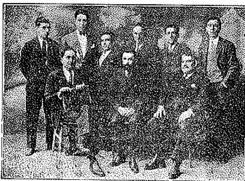
Villaviciosa.—Actual Junta Directiva de la Biblioteca Circulante del Ateneo.

Es una humilde institución fraternal y humanitaria, a la que ricos y pobres deben pertenecer; los primeros, apoyándola con sus recursos anuales, mensuales o temporales; y con ese apoyo material que los ricos pueden y deben hacer, consiguen: primero, la satisfacción que produce una buena obra hecha a favor del prójimo, y segundo, agradecer a Dios con la caridad