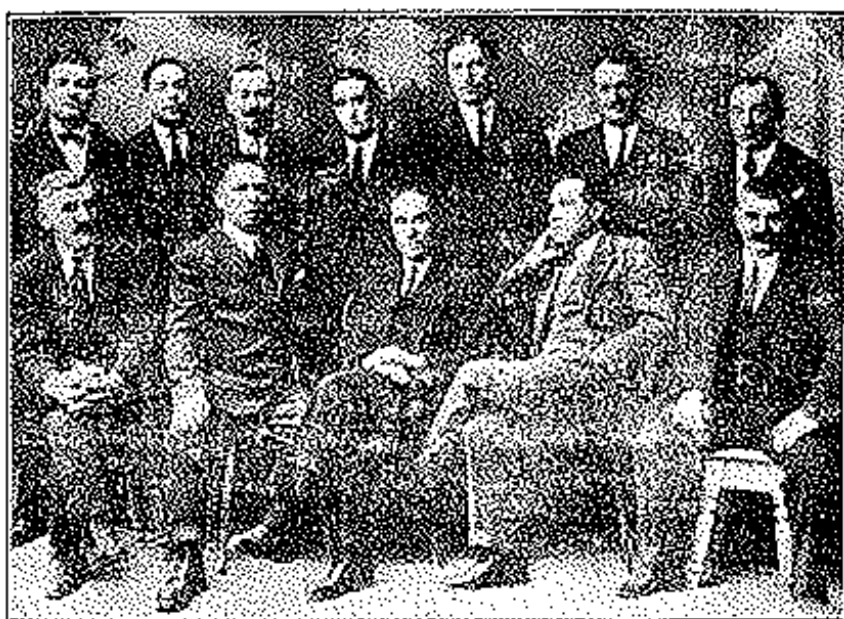
Villaviciosa.—Actual Junta Directiva del Ateneo Obrero.

de de la sociedad de la cual forma parte integrante.