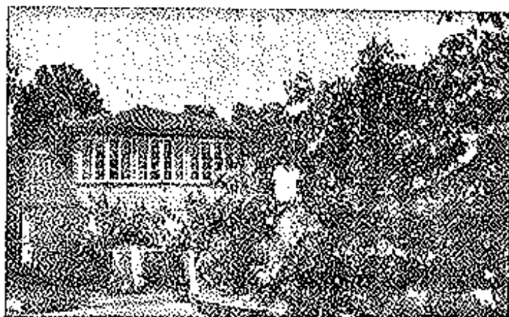
Villaviciosa.—Vista del hermoso patio de «El Congreso»

de kilogramos diarios de pan de todas clases que se ve precisado enviar a los concejos limítrofes, donde, como en Villaviciosa, ha adquirido legítima y justa fama.