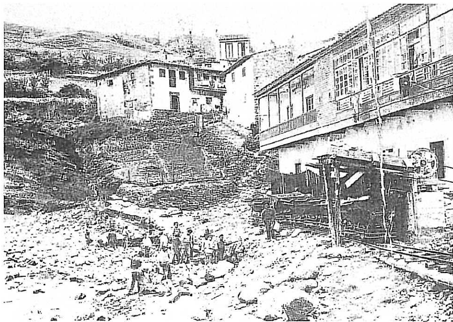
Inicio de las obras del puerto de Tazones (1934).

Todo esto deue de nos partes seer tenido e gardado saluo la postura que nos abbat e conuiento e concejo podermos fazer con don Pedro Aluariz ho con otro alguno si nos embargasse que deue las postura seer de común de per medio dar al abbat e al conuiento el quinto dando los dos maravedís e ocho dineros commo dicho ye, e nos el concejo auer los tres quartos. E deuemos nos el abbat e couiento dar la meatat de los costos que acaecieron en se-