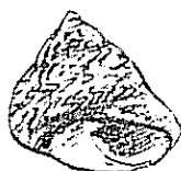
PEONZA (MONODONTA LINEATA)

En este sentido goza de particular aprecio la peonza ( Monodonta lineata ), de 2,5 centímetros de diámetro, igual de alto que ancho, con la concha apuntada y color uniforme gris jaspeado de líneas oblicuas más oscuras. Se le