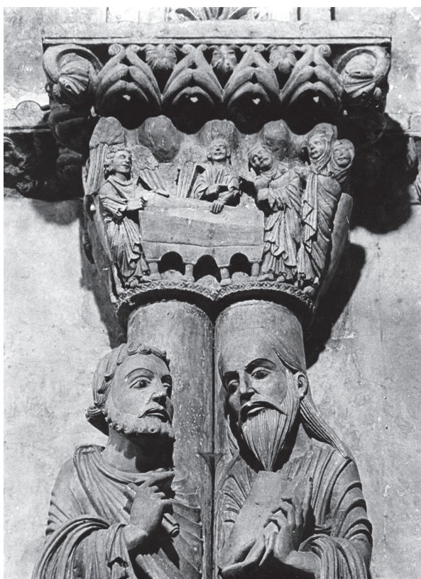
Fig. 8. San Pedro y San Pablo en 1925.