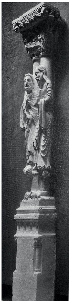
Fig. 7. Vaciado en yeso patinado del conjunto escultórico de San Pedro y San Pablo realizado por el Taller del Museo Nacional de Reproducciones Artísticas de Madrid.