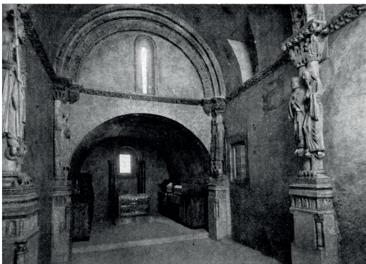
Fig. 4. Interior de la Capilla de San Miguel hacia el Santuario una vez finalizadas las obras en 1940.