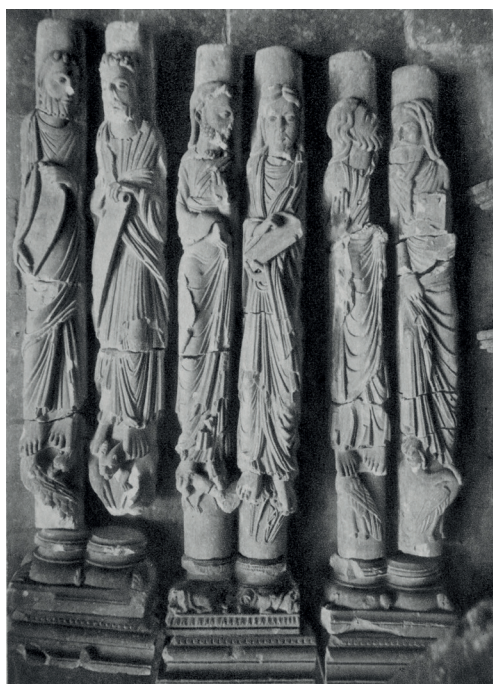
Fig. 1. Conjunto de seis apóstoles con las fracturas producidas por la explosión.

Esperemos pues, que ésta intervención, actualmente en fase de ejecución, nos desvele algún resto más de la profusa policromía que revestiría el conjunto escultórico de la Cámara Santa de la Catedral de Oviedo, uno de los apostolados más universales de nuestro Románico Asturiano.