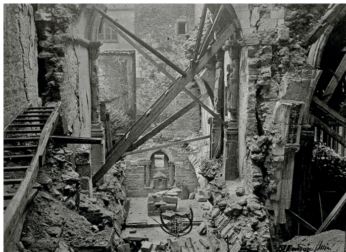
Fig. 3. Estado de la Cámara Santa después de la explosión de 1934.