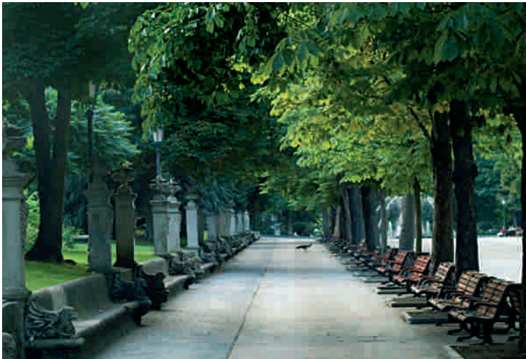
PARQUE SAN FRANCISCO

Comenzando por aquellos destinados a los más jóvenes en las calles Quintana y Rosal, el ambiente universitario se respira en las calles Mon,