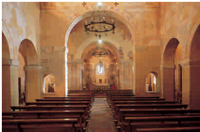
IGLESIA DE SAN JULIÁN DE LOS PRADOS ( prerrománico, s. IX)

Visitas cada 30 minutos, los horarios están supeditadas a cambios imprevistos en función de celebraciones extraordinarias.