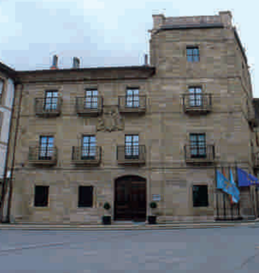
PALACIO DE FERRERA (s. XVII)

Uno de los numerosos palacios avilesinos, convertido hoy en hotel.