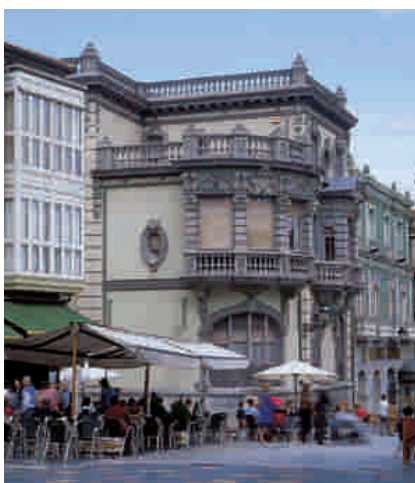
PALACIO DE BALSERA (modernismo, s. XX)

Fue la primera ciudad que explotó “industrialmente” lo que hace años comenzó a denominarse “zona de copas”. Eso fue en las décadas de los sesenta y setenta del pasado siglo XX, cuando Avilés era una población industrial donde “corría mucho dinero”. Entonces, la masiva diversión nocturna se centró en el barrio de Sabugo, histórico barrio marinerero que ya no