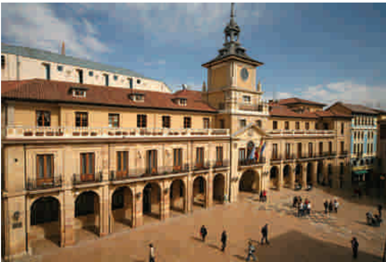
PLAZA DE LA CONSTITUCIÓN

Fiesta Gastronómica del Desarme. Día 19. En este día los restaurantes ovetenses ofrecen un menú de garbanzos con bacalao y espinacas, además de callos y postres tradicionales asturianos (frixuelos y casadieles). El origen de esta celebración es discutido, aunque varias fuentes coinciden en situarlo en la comida con que fueron agasajados los soldados de las tropas isabelinas durante la guerra carlista.