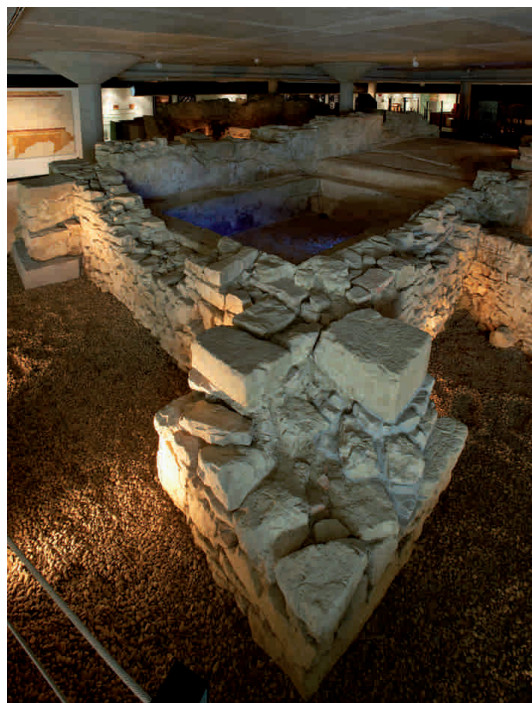
INTERIOR DE LAS TERMAS ROMANAS DE CAMPO VALDÉS

El recorrido comienza en el barrio antiguo, visitando dos importantes vestigios del asentamiento romano. En la plaza de Campo Valdés se encuentran las mayores y mejor conservadas Termas del Norte de España (finales del s. I d. C.). Situada dentro del recinto amurallado, eran públicas y estaban organizadas mediante estancias paralelas entre sí y perpendiculares a un corredor según la gradación frío-calor. Desde aquí nos acercamos a la Plaza de Jovellanos para observar los restos de la Muralla que tuvo una longitud aproximada de un kilómetro y cuya puerta, flanqueada por torres de base cuadrada, estaba situada donde actualmente se encuentra la Torre del Reloj.