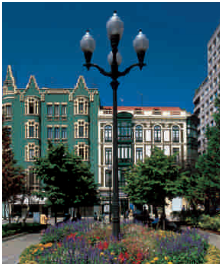
PLAZA DEL INSTITUTO O DEL PARCHÍS

Las fachadas modernistas y art-decó, de principios del s. XX, son numerosas en el centro de la ciudad.