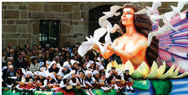
FIESTA DEL BOLLO

Fiesta del Bollo. Domingo y lunes de Pascua. Declarada de Interés Turístico Nacional. Fiesta instaurada por Claudio Luanco en 1892 como acto de concordia entre dos familias en pugna por cuestiones comerciales. Los actos más relevantes son el Desfiles de Carrozas, la Comida en la Calle