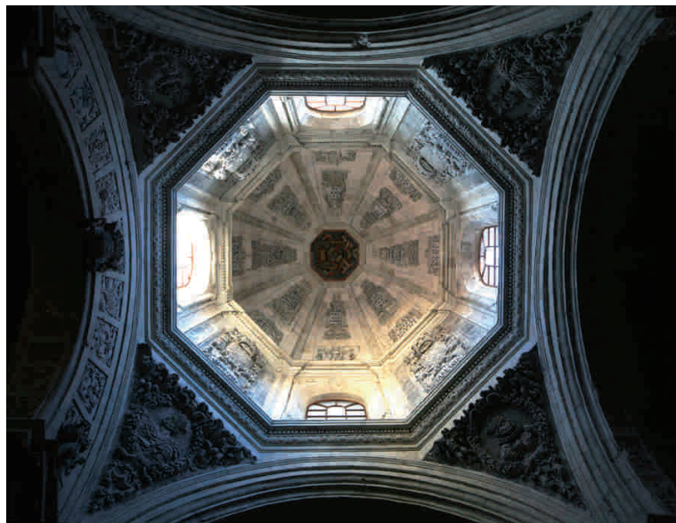
GIROLA DE LA CATEDRAL

La calle Sta. Ana desciende convertida en calle Mon desde la que, por el callejón Adolfo Alvarez Folgueras, se entra en la plaza de Trascorrales, uno