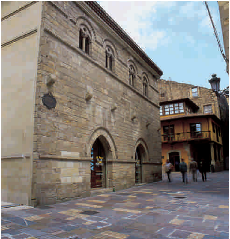
PALACIO DE VALDECARZANA (s. XIV)

Bello e infrecuente ejemplo, en Asturias, del Gótico civil.